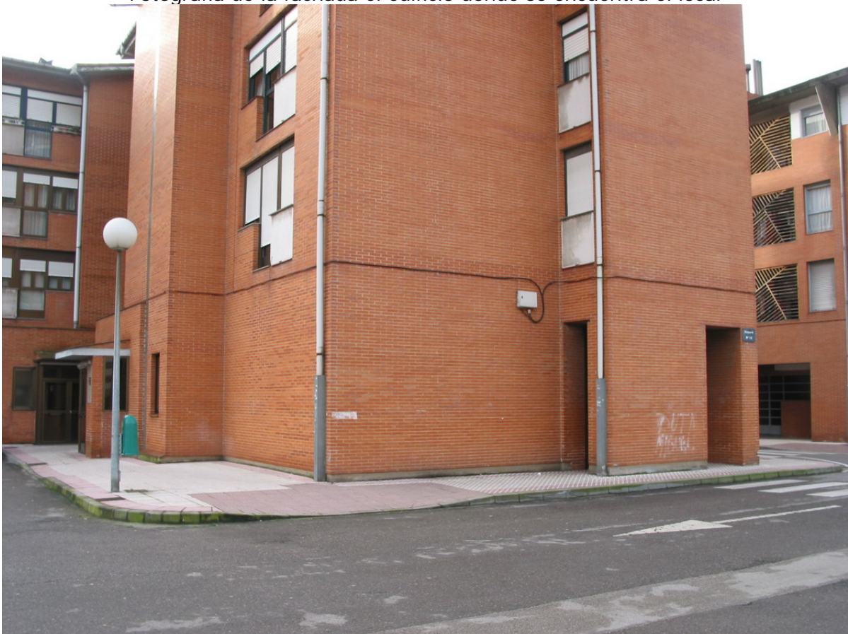
Fachadas fondo e izquierda del local