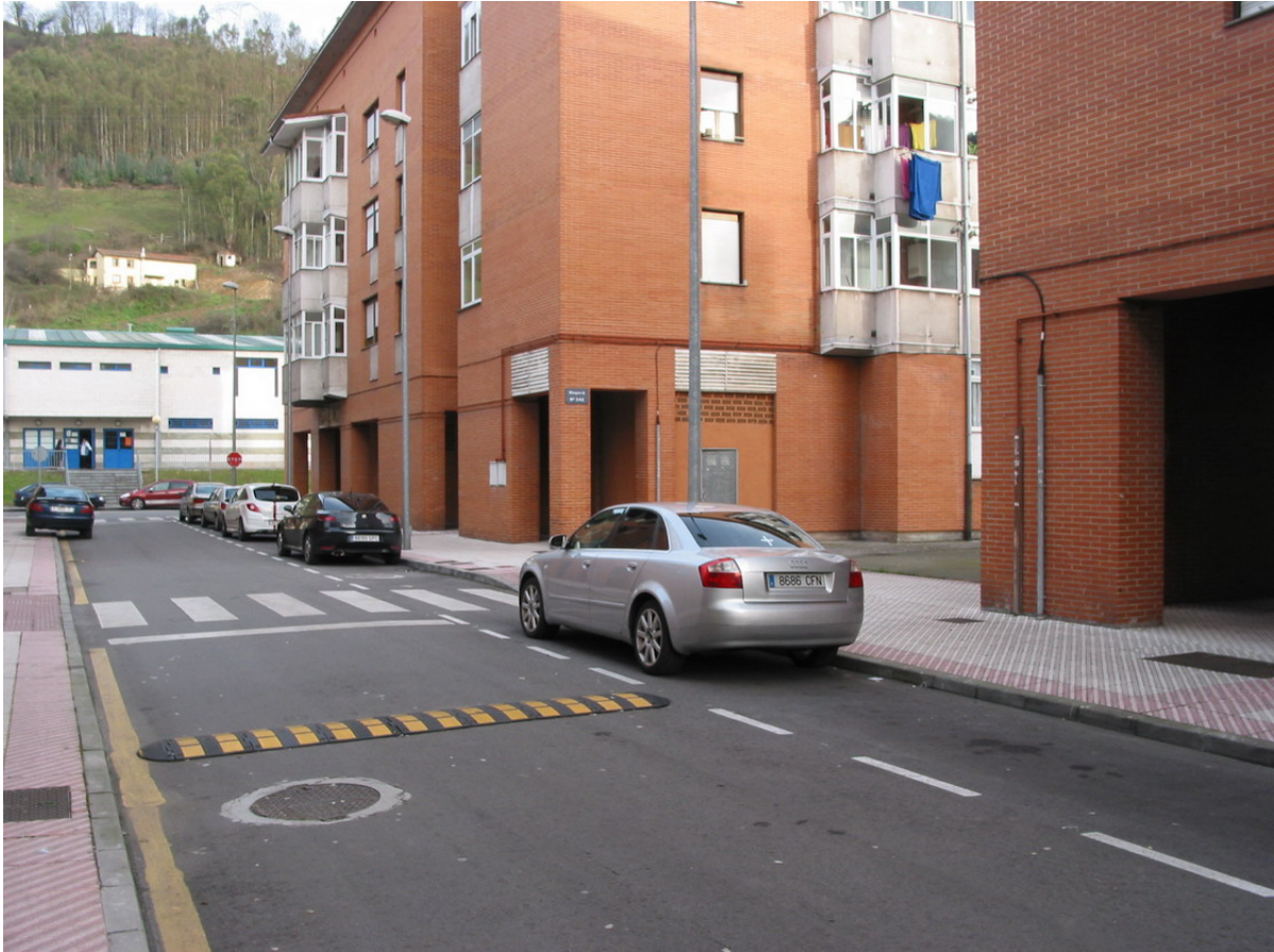
Fotografía de la fachada el edificio donde se encuentra el local