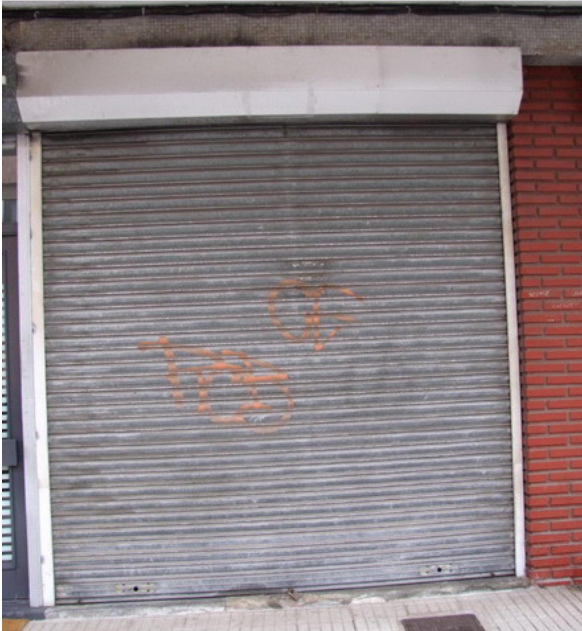
Fachada de acceso