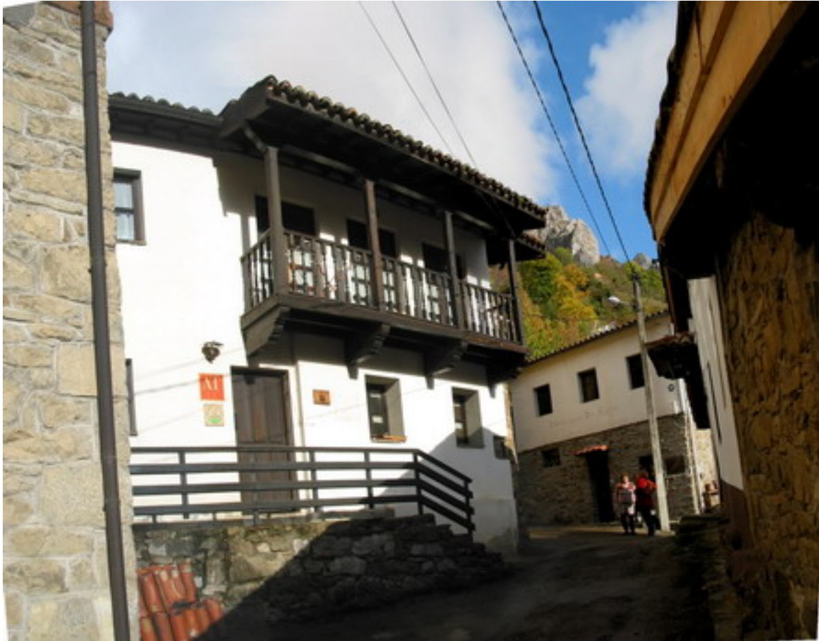
Fotografía de la fachada